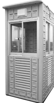
ガードマンハウス (小)