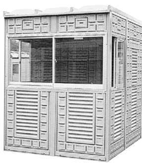
ガードマンハウス (大)