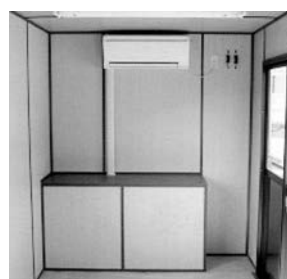
CH-4500、CH-5400 室内 (エアコン取付側)