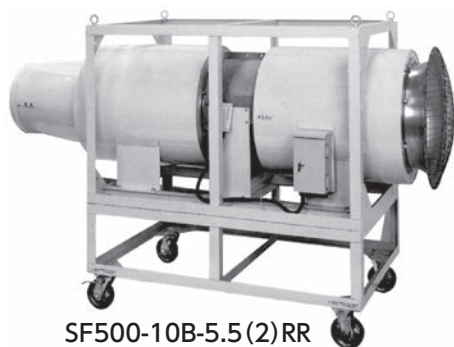
SF500-10B-5.5 (2) RR