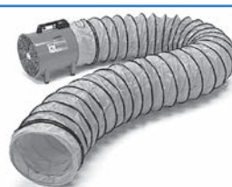
プレキシブルダクト