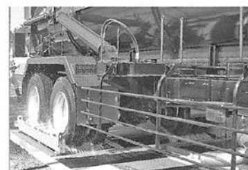
ダブルタイヤを高圧スプレー噴射水で洗浄