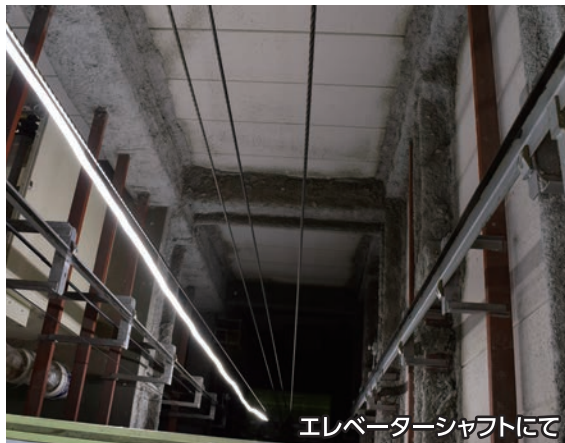
エレベーターシャフトにて