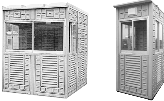
ガードマンハウス (大)